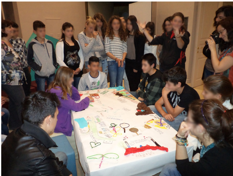
Εικόνα 2. Στο μουσείο: εικονογράφηση της ιστορίας του Ευηνίωνα.