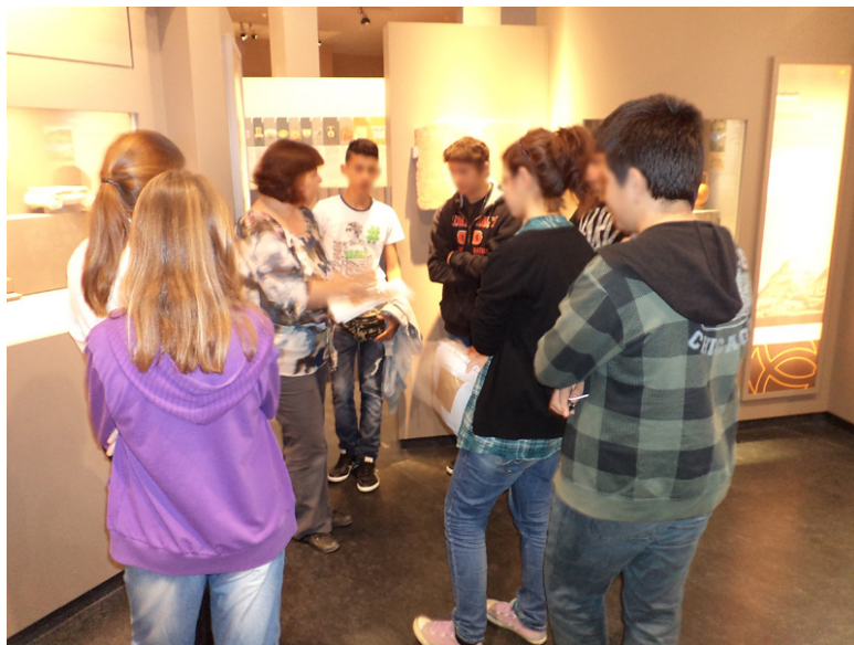
Εικόνα 1. Επίσκεψη στο Αρχαιολογικό Μουσείο Μεσσηνίας.