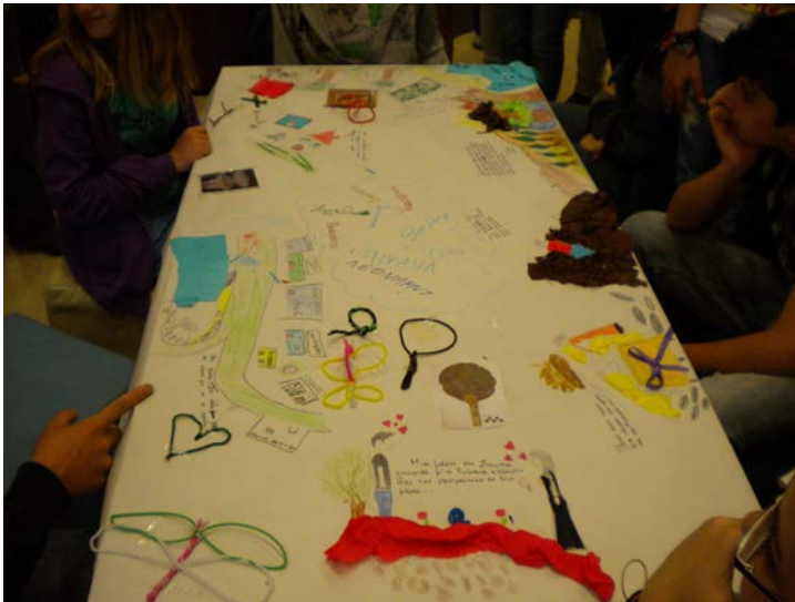
Εικόνα 3. Στο μουσείο: το ομαδικό έργο των μαθητών.

Μια δράση με σαφή διαπολιτισμικό χαρακτήρα: δημιουργία της ιστορίας με βάση τα αντικείμενα στο πλαίσιο του ταξιδιού.